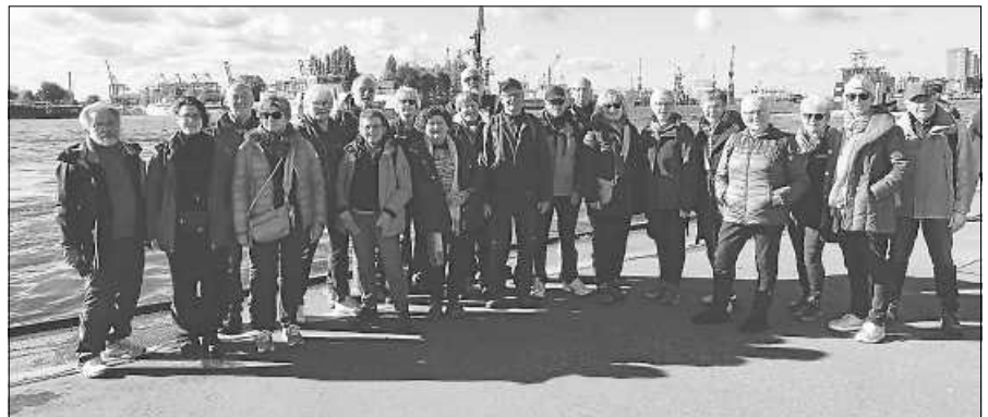
Naturfreunde Gaggenau-Gernsbach bei der Ankunft in Hamburg.

Die Naturfreunde Gernsbach verbrachten Mitte Oktober eine erlebnisreiche Woche in Hamburg. Ein Einheimischer führte die Truppe an bekannte und unbekannte Ecken der Stadt. Neben einer Barkassenfahrt durch die Speicherstadt wanderten die Vereinsmitglieder auch außerhalb auf dem Heidschnuckenweg und entlang der Alster. Es blieb auch